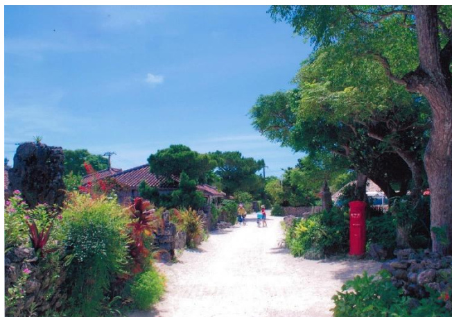
銀賞「美し過ぎるサンゴの島」(沖縄県竹富町竹富108)