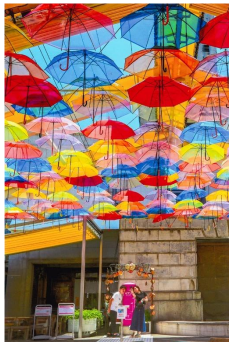
銀賞「幸運のポスト」(島根県松江市 カラコ工房)